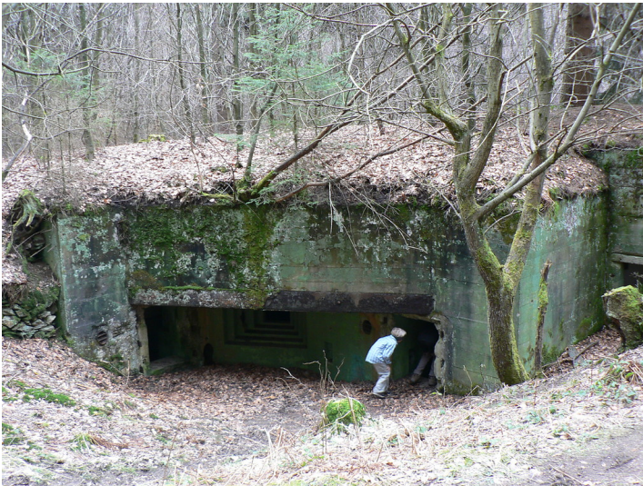
Bunkergruppe im Buhler bei Simmerath (2008)