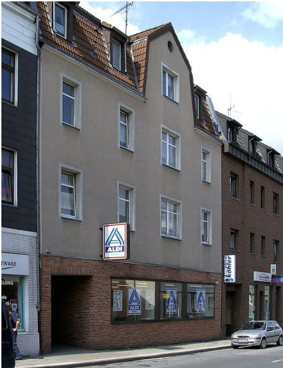
Die erste Filiale des Discounters ALDI in Essen-Schonnebeck, Huestraße 89 (2006)