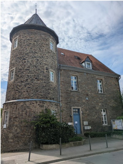
Der ehemalige mittelalterliche Rittersitz Haus Heck in Essen-Werden (2025).