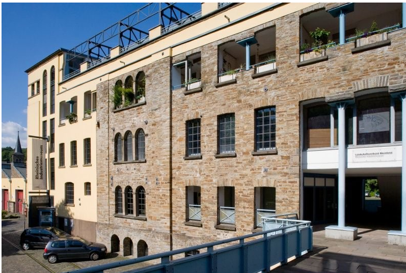
LVR-Industriemuseum Engelskirchen, Baumwollspinnerei Ermen & Engels (2011)