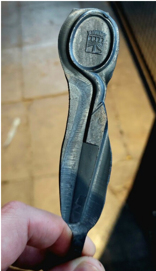
Ein Scherenrohling in der Gesenschmiede Hendrichs des LVR-Industriemuseums Solingen (2023).