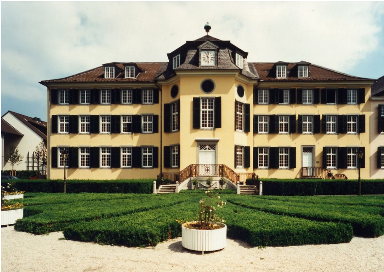
Herrenhaus Cromford, Sitz des LVR-Industriemuseums Ratingen