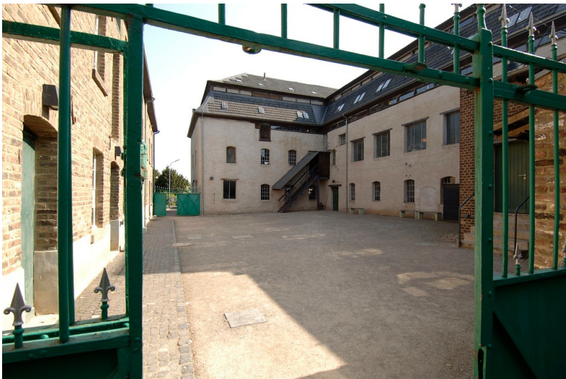
LVR-Industriemuseum Schauplatz Euskirchen-Kuchenheim (2006)