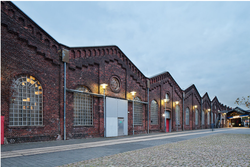
Oberhausen, ehemalige Zinkfabrik Altenberg, Hansastr. 18