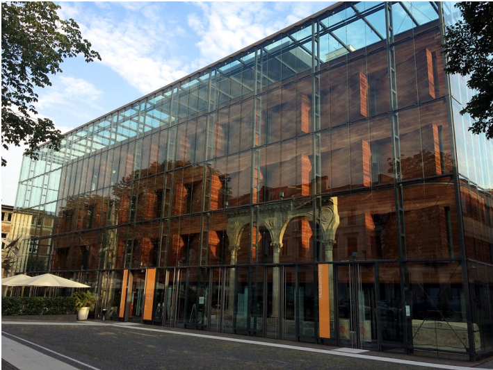
LVR-LandesMuseum Bonn (2018), Frontansicht des Museumsgebäudes von der Colmantstraße aus.