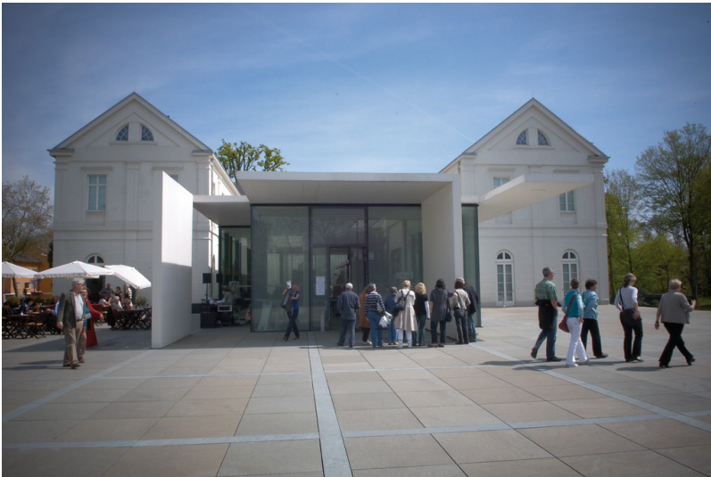
Max Ernst Museum Brühl des LVR, Außenansicht (2010).