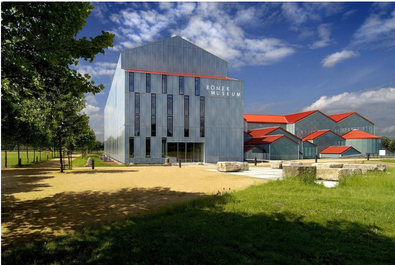
LVR-RömerMuseum im Archäologischen Park Xanten, Außensicht des Museumsbaus mit den Thermen rechts (2011)