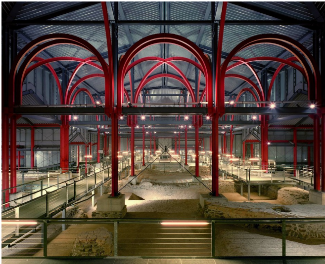
Große Thermen im LVR-Archäologischen Park Xanten