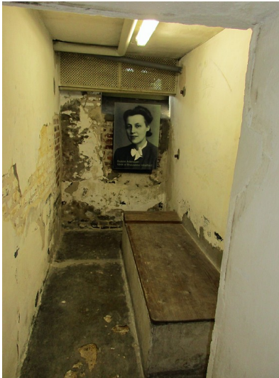
Blick in eine der Zellen der heutigen Gedenkstätte zur Geschichte der Arbeitsanstalt Brauweiler (2016).