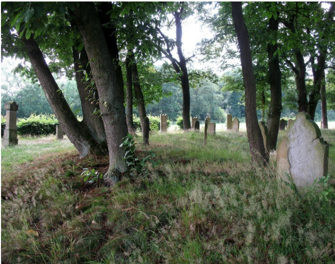
Der jüdische Friedhof am Heesberg in Xanten (2010).