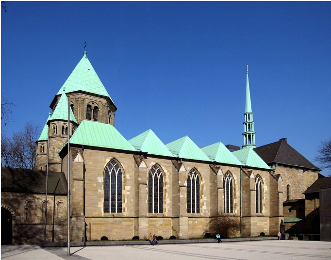
Das Essener Münster, die ehemalige Kirche des Damenstifts in Essen (2011).