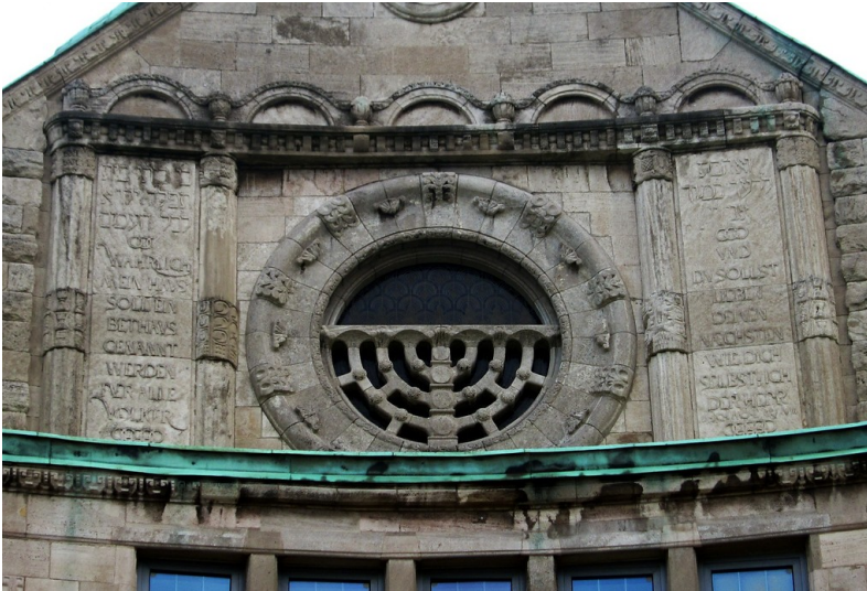
Detailansicht der oberen Westfassade der Alten Synagoge Essen (2014)