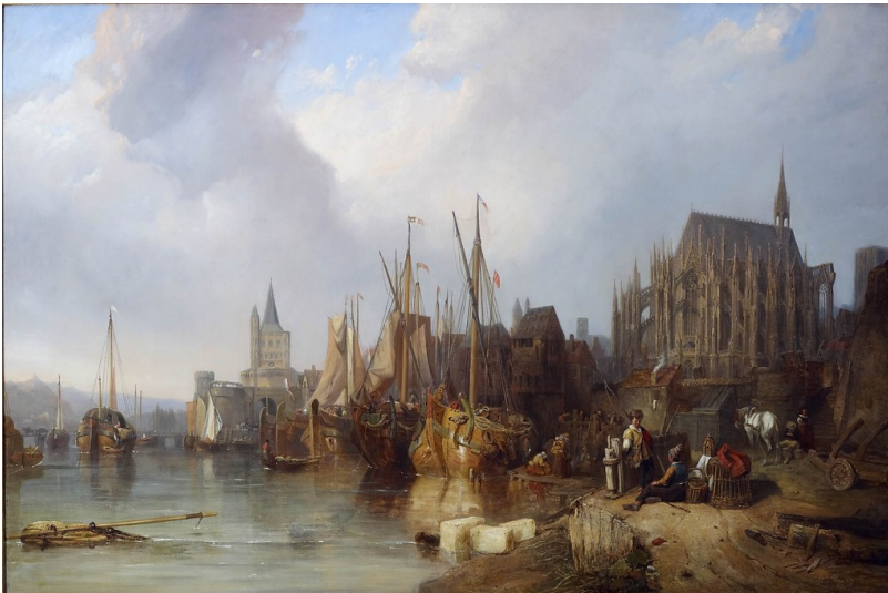
Ölgemälde von Clarkson Frederick Stanfield: Das Kölner Rheinufer mit dem unvollendeten Dom (um 1826) Fotograf/Urheber: W. C. Stanfield