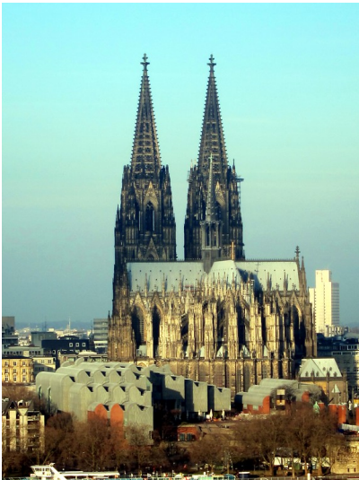
Der Kölner Dom von Köln-Deutz aus gesehen, im Vordergrund links die Kölner Philharmonie (2015).