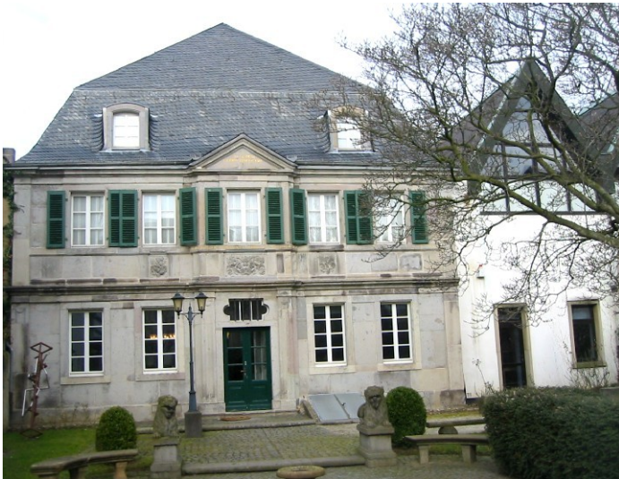
Siebengebirgsmuseum der Stadt Königswinter, das barocke Bürgerhaus (2009)