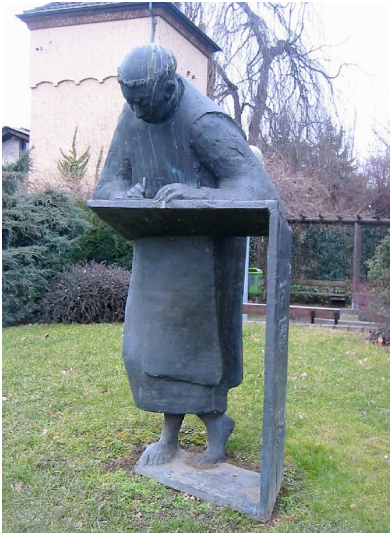
Die Statue des Caesarius von Heisterbach in Oberdollendorf (2008), ein Werk des deutschen Bildhauers Ernemann Sander aus dem Jahr 1991.