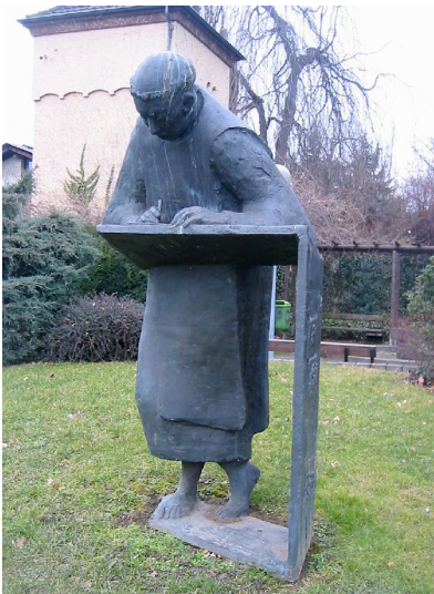
Die Statue des Caesarius von Heisterbach in Oberdollendorf (2008), ein Werk des deutschen Bildhauers Ernemann Sander aus dem Jahr 1991.