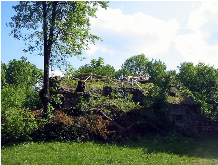
Burgruine Rosenau (2011)