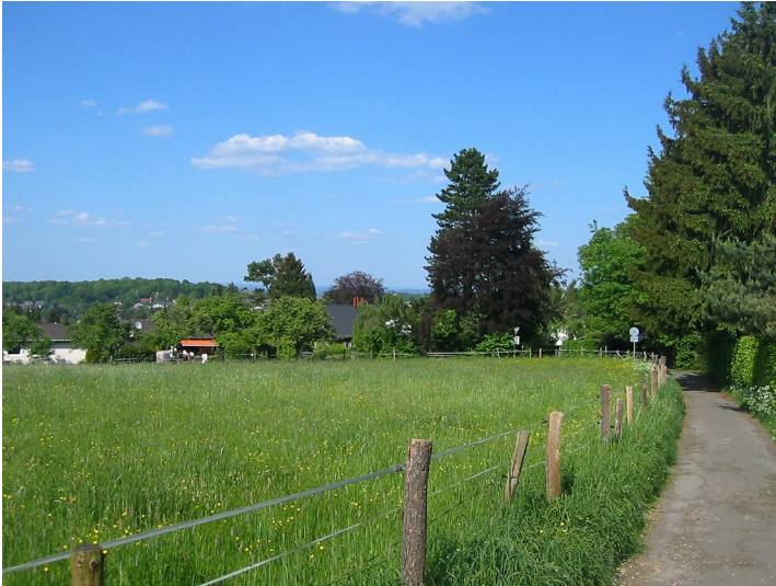
Blick auf Heisterbacherrott (2011)