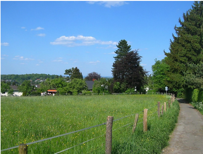
Blick auf Heisterbacherrott (2011)