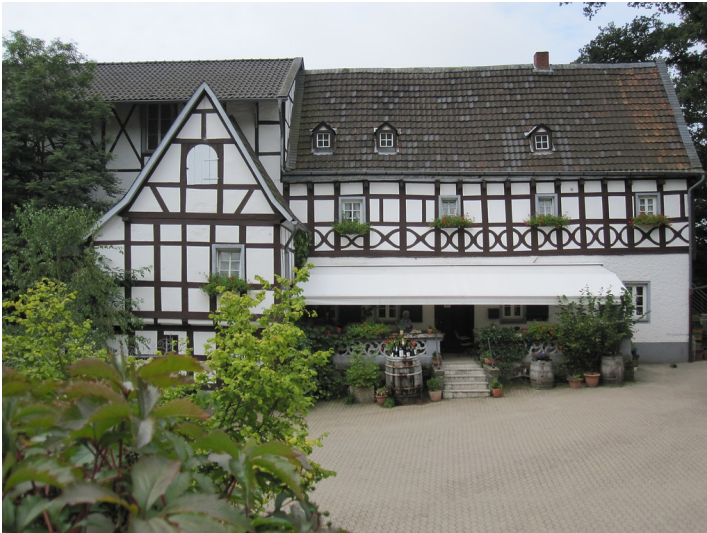
Weingut Gut Sülz in Königswinter-Oberdollendorf (2010)