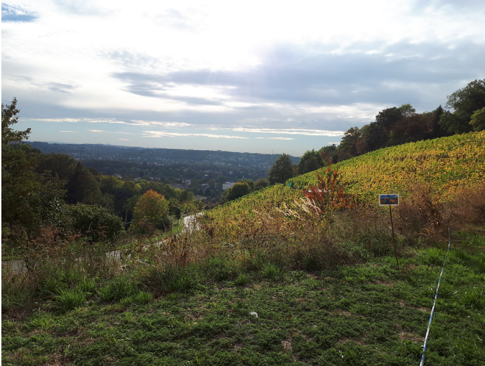
Historischer Weinberg "Pfaffenröttchen" oberhalb von Königswinter (2018).

Schlagwörter: Weinberg , Zisterzienserorden , Abtei Fachsicht(en): Kulturlandschaftspflege, Landeskunde Gemeinde(n): Königswinter Kreis(e): Rhein-Sieg-Kreis Bundesland: Nordrhein-Westfalen