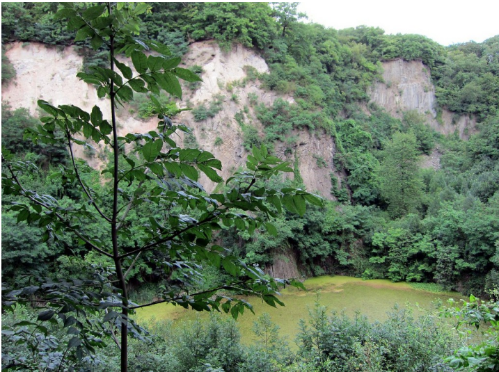
Steinbruch Weilberg im Siebengebirge (2011)