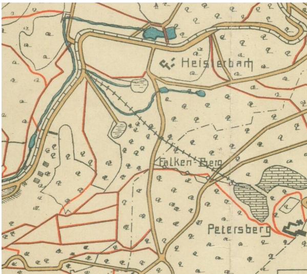
Steinbrüche am Peterberg Nord und Ost: Der Verlauf der Bremsbahn vom Petersberg Nordbruch bis in das Heisterbacher Tal ist in dieser Wanderkarte von 1906 als dünne Linie mit Querstrichen eingetragen.