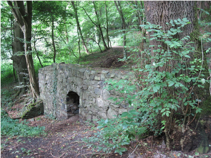
Ruinenhafte Überreste von Mauern der früheren Schleifmühle im Heisterbacher Mühlental (2010)