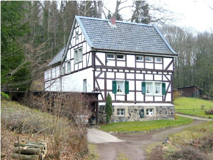
Die so genannte "Idyllenmühle" (Heisterbacher Mühle) im Heisterbacher Mühlental (2009)