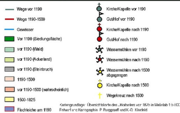
Thematische Karte mit verschiedenen Gütern und Mühlen der Zisterzienserabtei Heisterbach (2010)