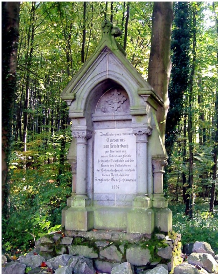
Caesariusdenkmal an der Chorruiue der Abteikirche (Abtei Heisterbach)