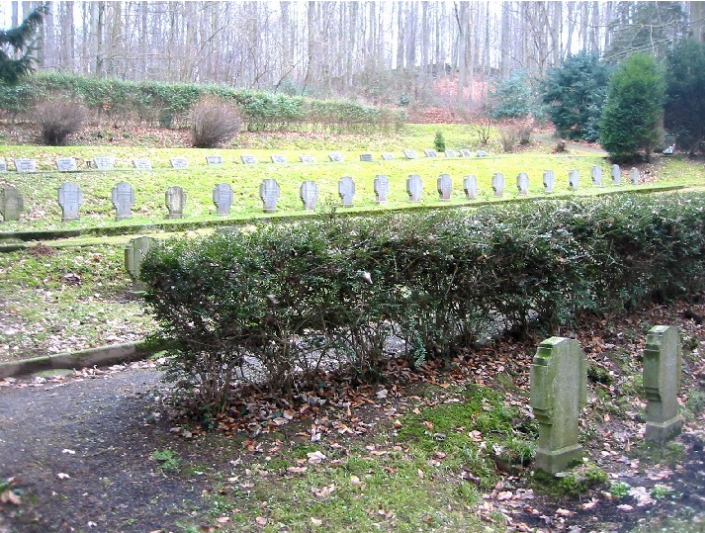
Der Waldfriedhof der Cellitinnen in Heisterbach, Grabstelle der Generaloberinnen (2009).