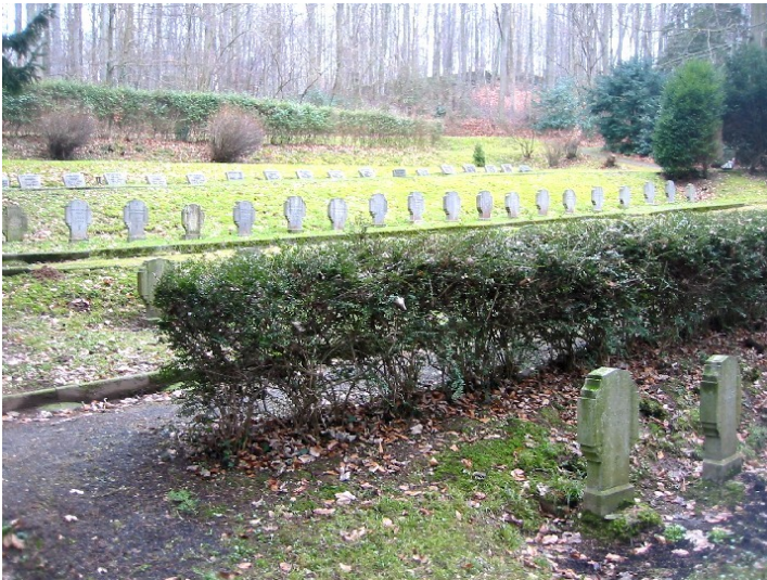
Der Waldfriedhof der Cellitinnen in Heisterbach, Grabstelle der Generaloberinnen (2009).