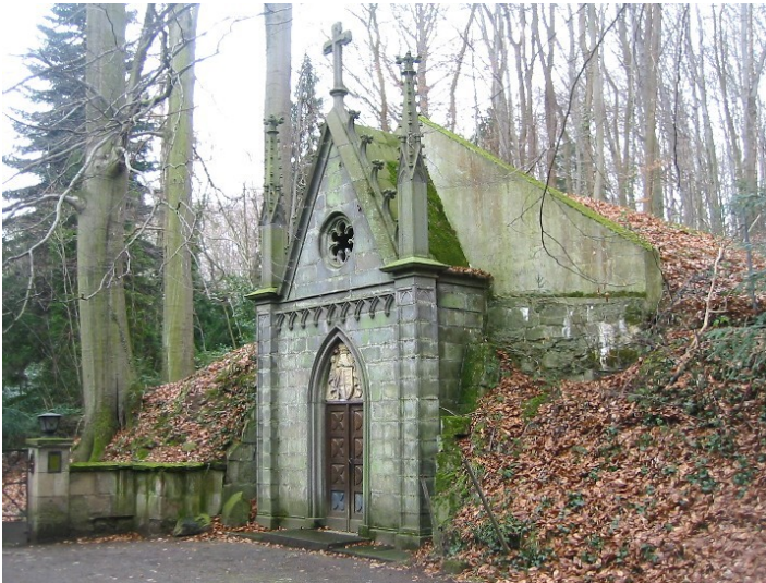
Mausoleum des Hauses zur Lippe-Biesterfeld (Abtei Heisterbach)