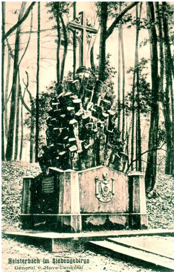
Historische Postkarte mit Abbildung des Grabmals von Hobe an der Abtei Heisterbach (um 1915).