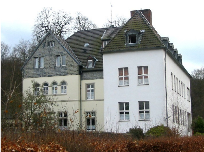
Das Hotel Krieger ("Hotel Heisterbach") an der Abtei Heisterbach (2009).