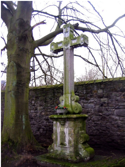
Prozessionskreuz (Zisterzienserabtei Heisterbach)