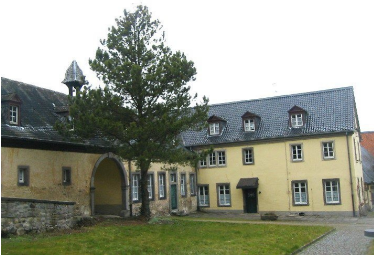
Ehemalige Wirtschaftsgebäude der Abtei Heisterbach (2009).