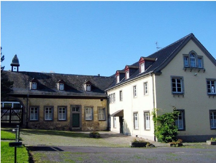
Ehemalige Wirtschaftsgebäude der Abtei Heisterbach (2009).