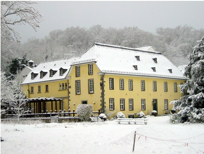
Ehemalige Wirtschaftsgebäude der Abtei Heisterbach im Schnee (2010).