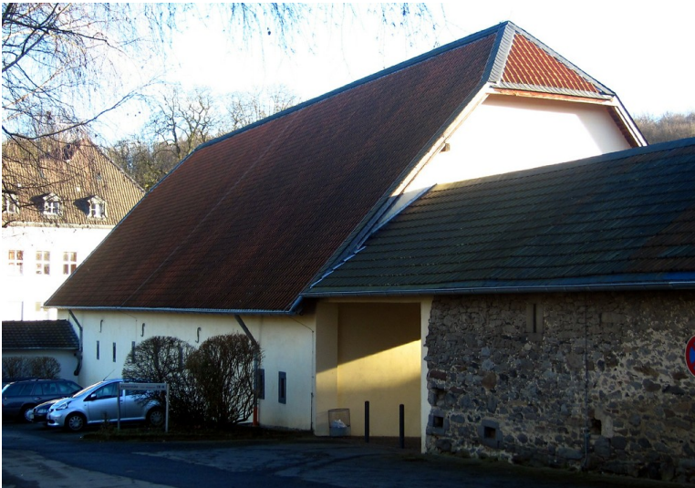
Die Zehntscheune der Abtei Heisterbach in rückwärtiger Ansicht (2014).