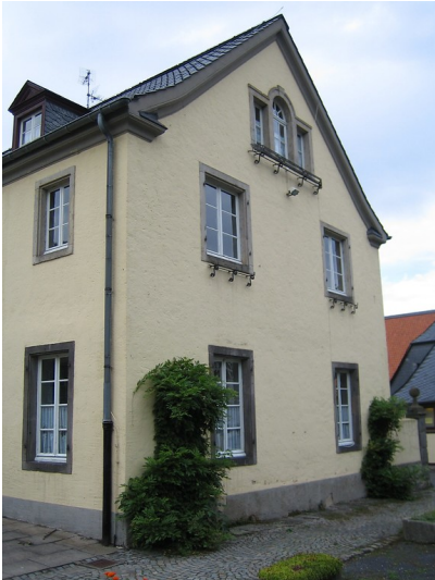
Ein Wirtschaftsgebäude der Zisterzienserabtei Heisterbach in Königswinter-Oberdollendorf (2005).