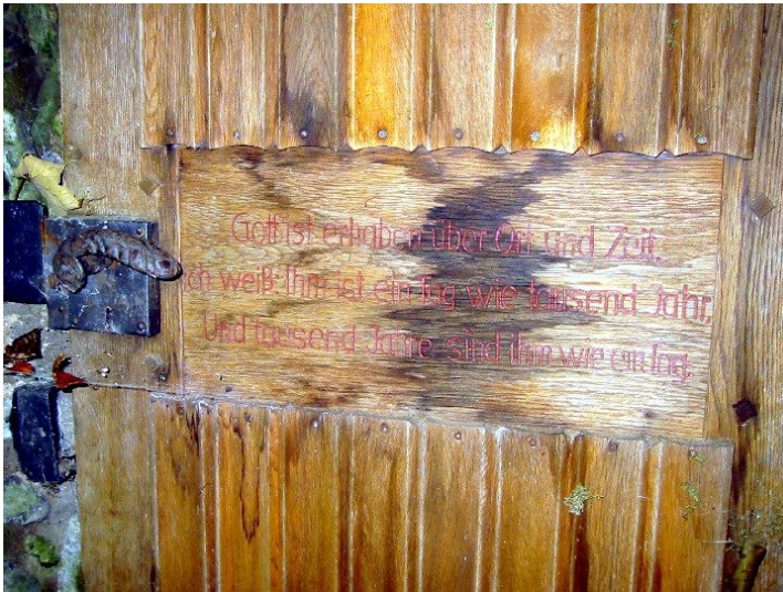
Inschrift an der Mönchspforte an der Abtei Heisterbach