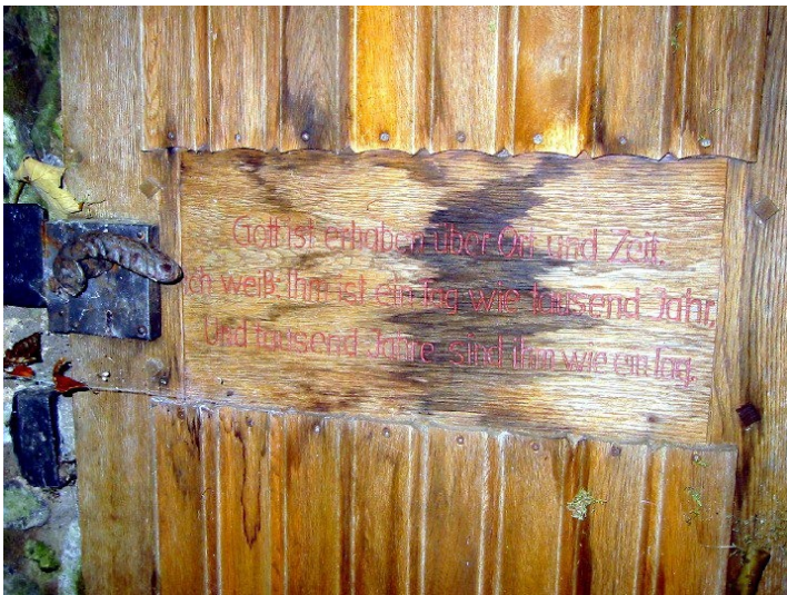
Inschrift an der Mönchspforte an der Abtei Heisterbach