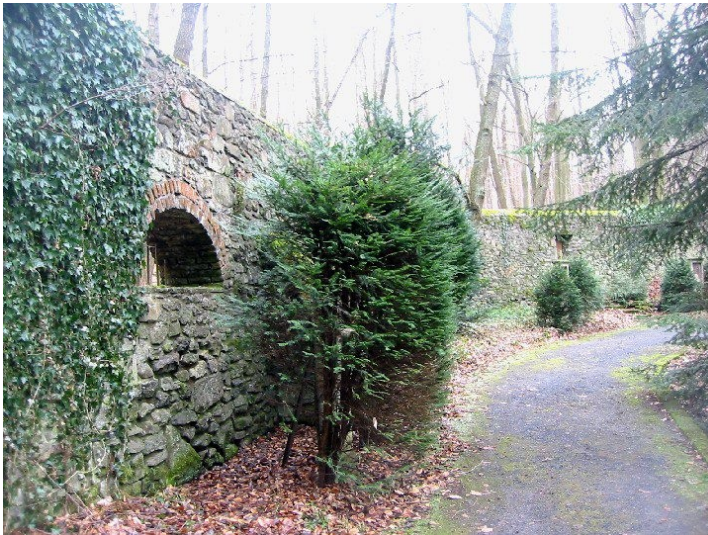
Die Mauer um den Immunitätsbezirk der Abtei Heisterbach (2008)