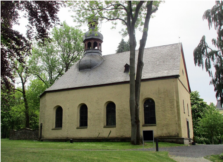
Die Wallfahrtskapelle Sankt Peter auf dem Petersberg oberhalb von Königswinter, Ansicht von Norden (2020).