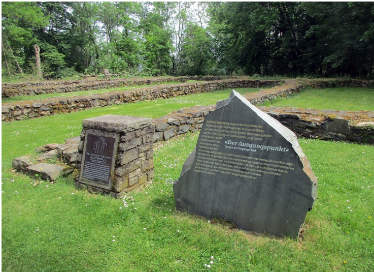
Gedenkstein an der früheren Augustiner-Klosterkirche mit Informationen zu dem Stift Sankt Peter als "Ausgangspunkt" der Zisterzienserabtei Heisterbach (2020)