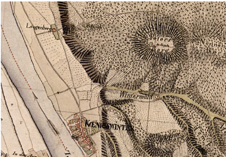
Ausschnitt einer historischen Karte der "Topographischen Aufnahme der Rheinlande" von Tranchot / von Müffling (1801-1828) im Bereich der Stadt Königswinter und des Petersbergs. Westlich des Petersbergs ist die historische Weinlage Pfaffenröttchen als "Paifferoth" eingetragen.

Schlagwörter: Klostergebäude , Zisterzienserorden Fachsicht(en): Kulturlandschaftspflege, Landeskunde Gemeinde(n): Königswinter Kreis(e): Rhein-Sieg-Kreis Bundesland: Nordrhein-Westfalen