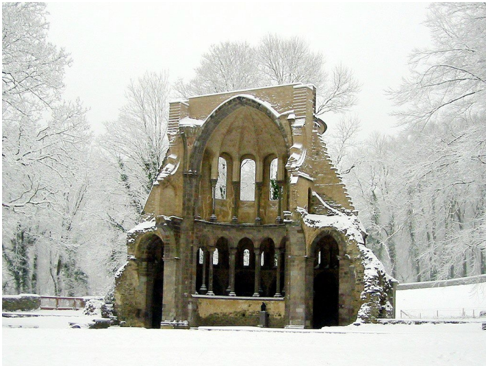
Die Chorruipe der Abtei Heisterbach im Schnee (2010).