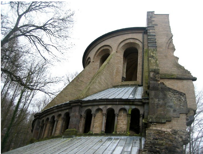
Teilansicht der Chorraumruine Heisterbach bei Königswinter, Rhein-Sieg-Kreis