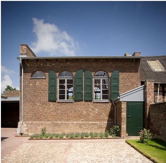
Südfassade der Landsynagoge Rödingen