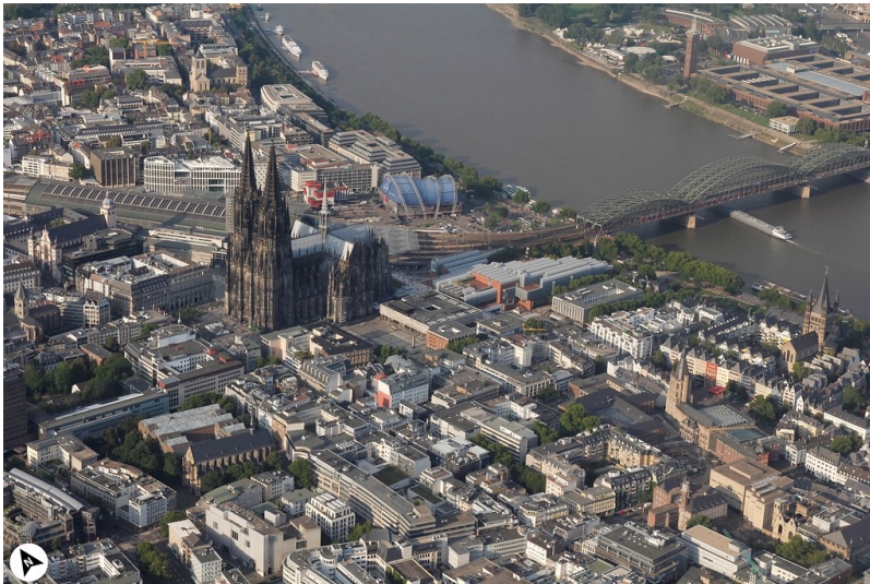
Lufbildaufnahme von Kölner Dom und Innenstadt mit Nordpfeil (2017)